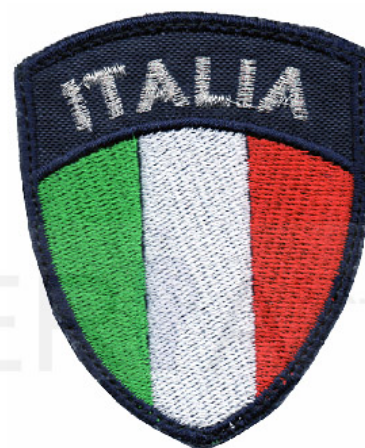
Scudo Italia ricamato cm 6 x cm 7