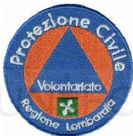
Distintivo Generico Diametro cm 7