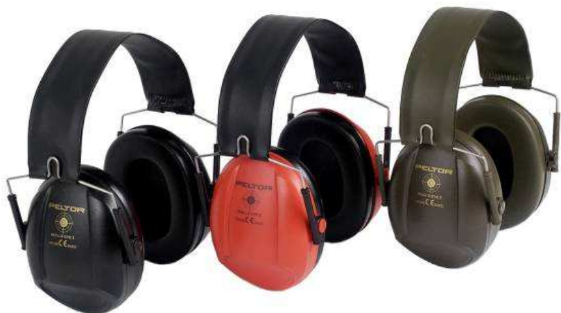
CUFFIA PELTOR Per poligono