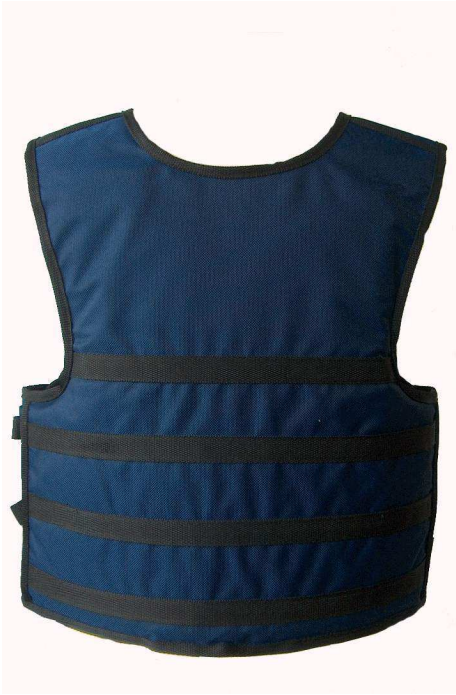
B.A. Mod. AMERIKA

(CERTIFICAZIONE del BANCO di PROVA NAZIONALE) Livello : IIIA (NIJ Standard 0101.03) Cal.44 Magnum – Cal. 9mm Parabellum Peso : 1150 gr. per pannello balistico , completo di borsa per il trasporto .